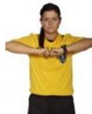
4. Omklamring, fastholdelse eller skub