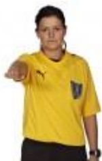
1. Indtræden i målfeltet