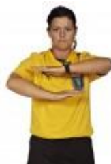
3. Skridt eller holde bolden mere end 3 sekunder